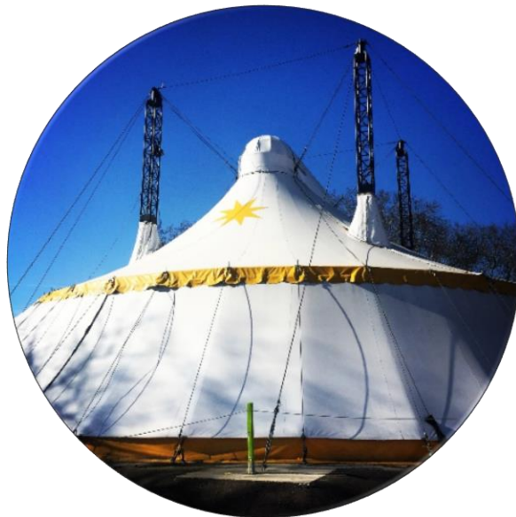
Chapiteau spectacle de Graine de Cirque

Chargée d'Administration : Camille POLETTI