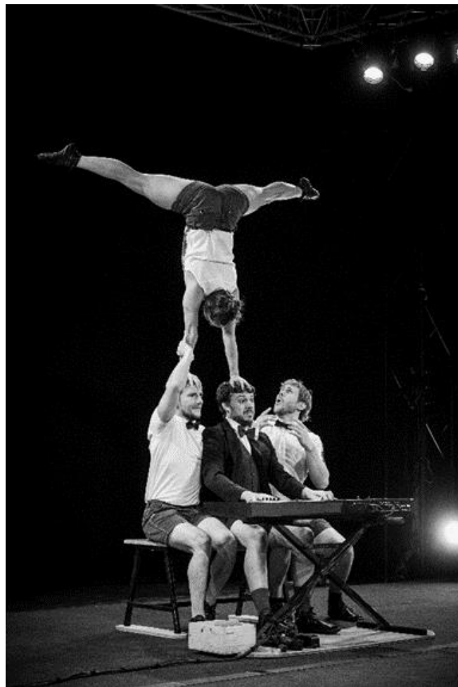
Noël en Piste 2018 – Photo de Dorothée Parent

Au-delà d'un enseignement et d'une simple transmission de techniques, l'éducation artistique et culturelle mobilise la sensibilité des enfants et des jeunes et met en jeu leur capacité à poser un regard personnel sur le monde.