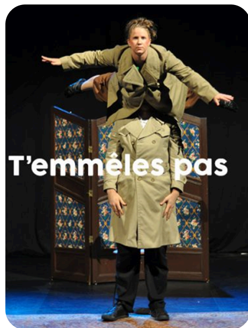
Cie du Fil à Retordre - page 8