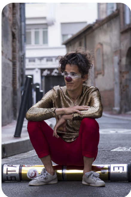
Cie Cirque du Ravi - page 6

Nous le conseillons donc vivement aux écoles maternelles , jusqu'au CP/CE1 (deux séances le lundi 15 décembre au matin). Ce spectacle est une superbe occasion pour les tout-petits de voir un 1 er spectacle.