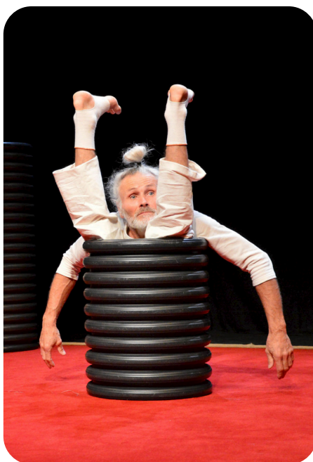
Cie Les Colporteurs - page 7